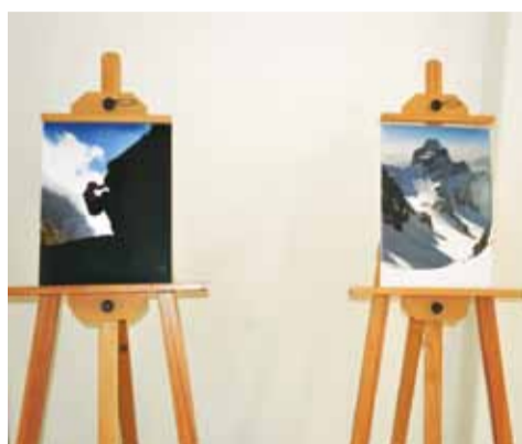
გაგრძელება გვ. 4 გვ.

უნივერსიტეტის ალპინისტური სექციის ბაზაზე 1959 წელს მოეწყო პირველი ქართული ექსპედიცია გიან-შანზე, რომელსაც ალექსი ივანიშვილის ხელმძღვანელობდა. ექსპედიციის შემადგენლობაში იყვნენ ჯუმბერ მქმარაშვილი, ლევან და მურაბ ახვლედიანები, გიორგი